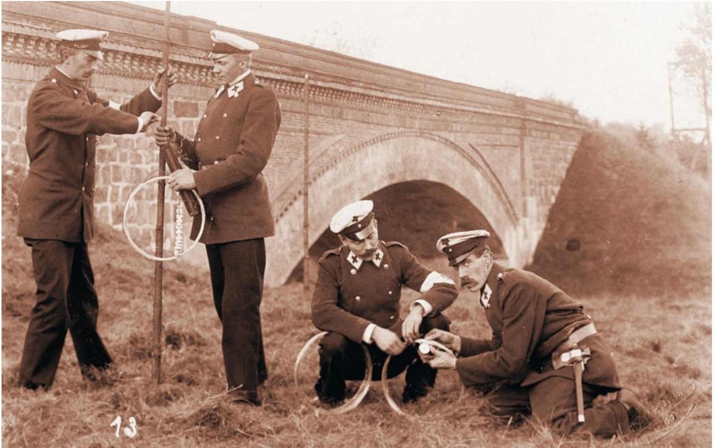
Früher: Rotkreuz-Helfer beim „Feldtelefonbau“ im Jahr 1899 in Reinbek

rem Fotos mit DRK-Sanitärern in historischen Uniformen bei einer „Bahnübung“ im Jahr 1925 und zwei Jahre später bei einer Kata-